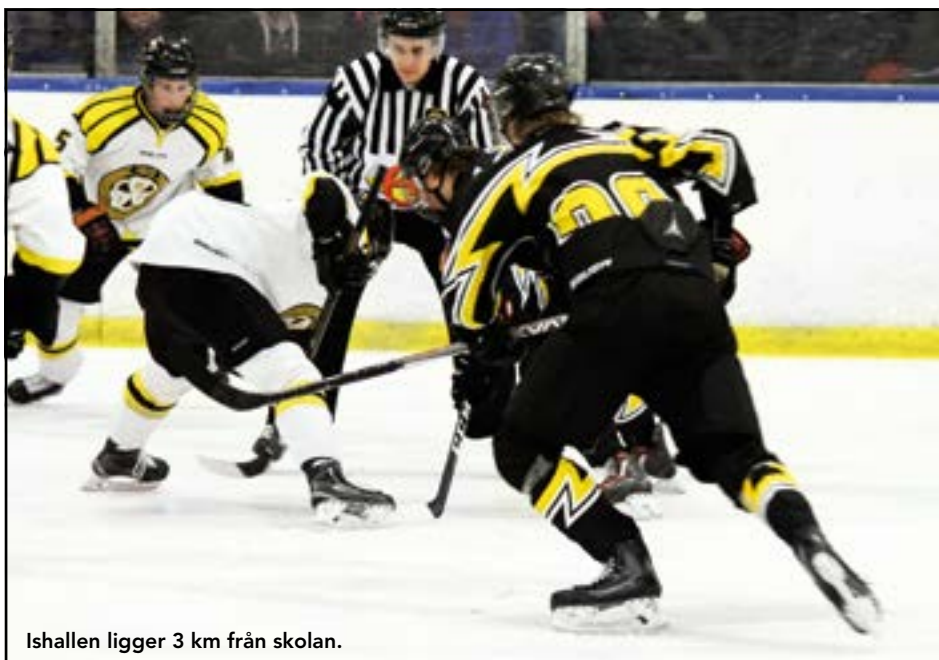
Ishallen ligger 3 km från skolan.