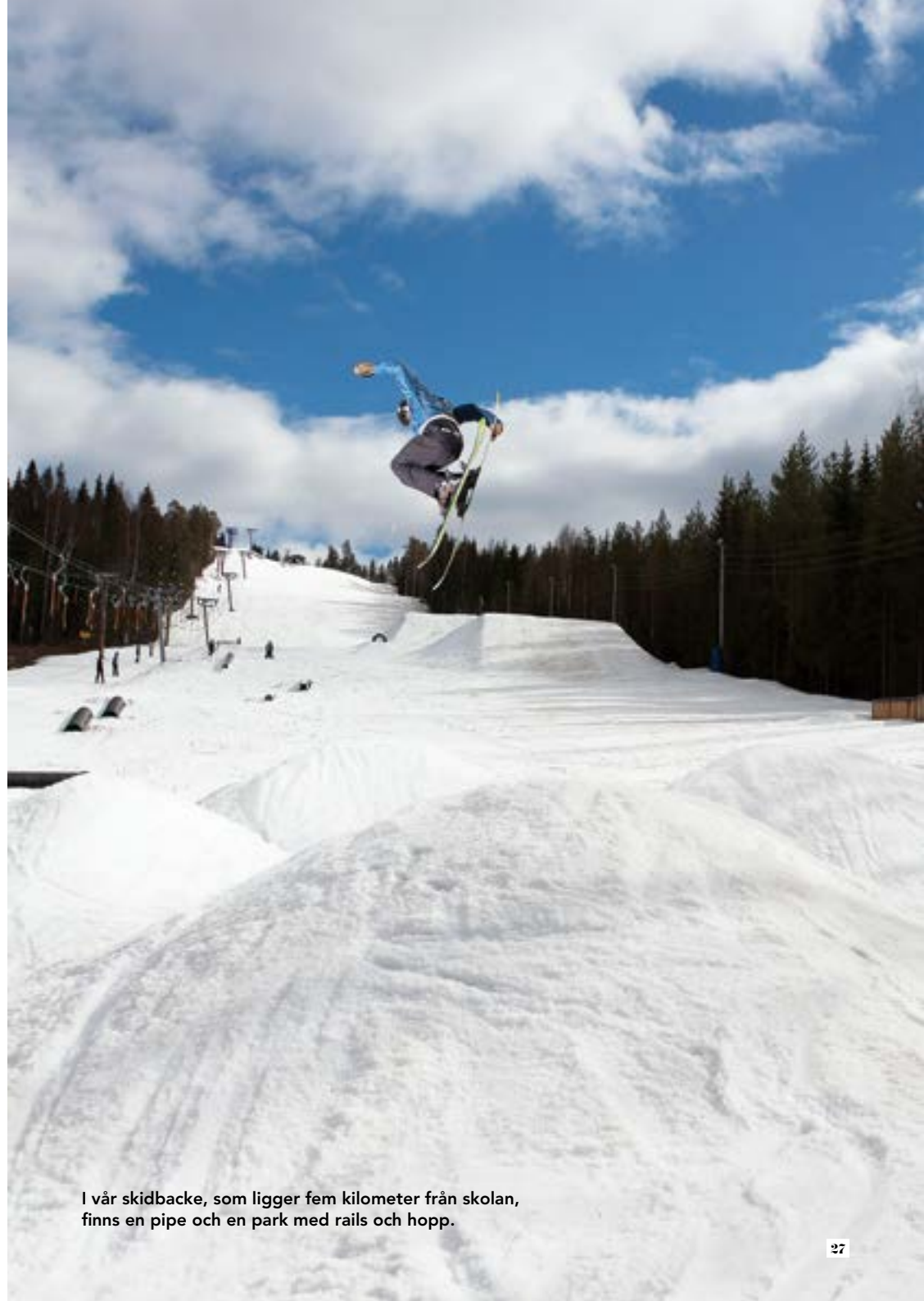
I vår skidbacke, som ligger fem kilometer från skolan, finns en pipe och en park med rails och hopp.