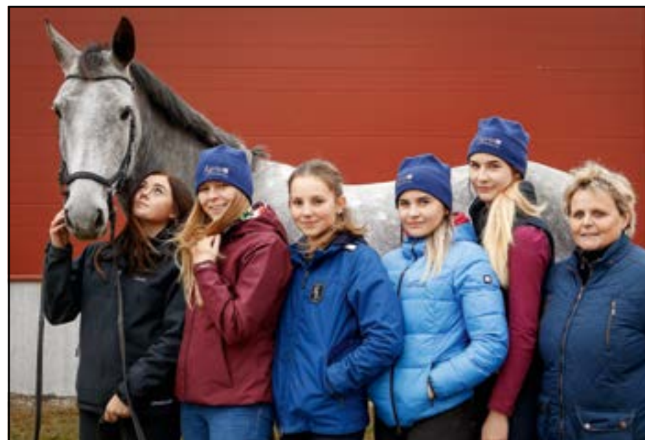
Vi tränar på Vännäs Ryttarförenings anläggning, cirka 4 km från Liljaskolan.